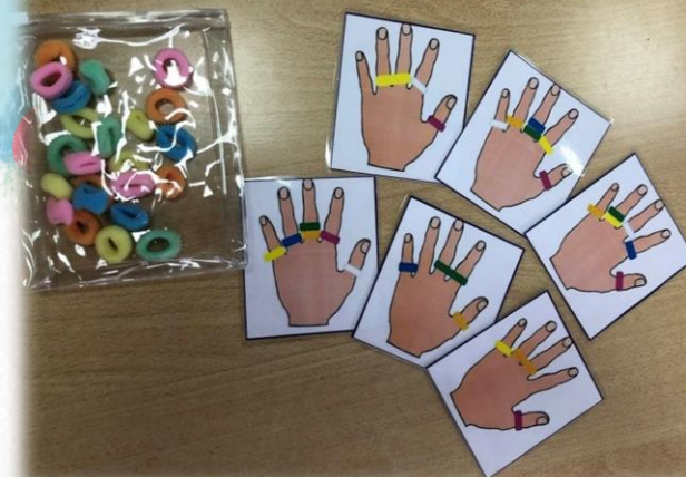
Дидактическая игра «Веселые резиночки»