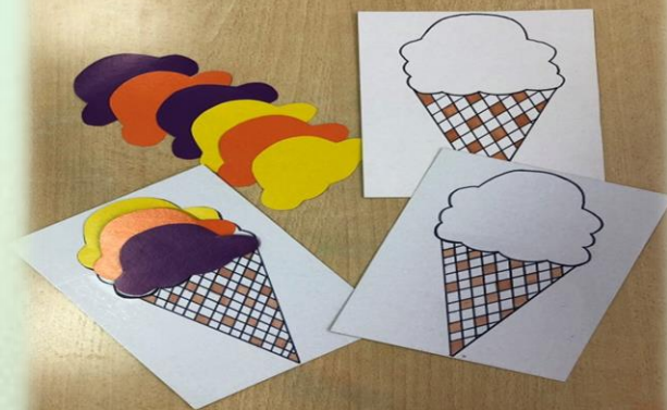
Дидактическая игра «Разноцветное мороженное»