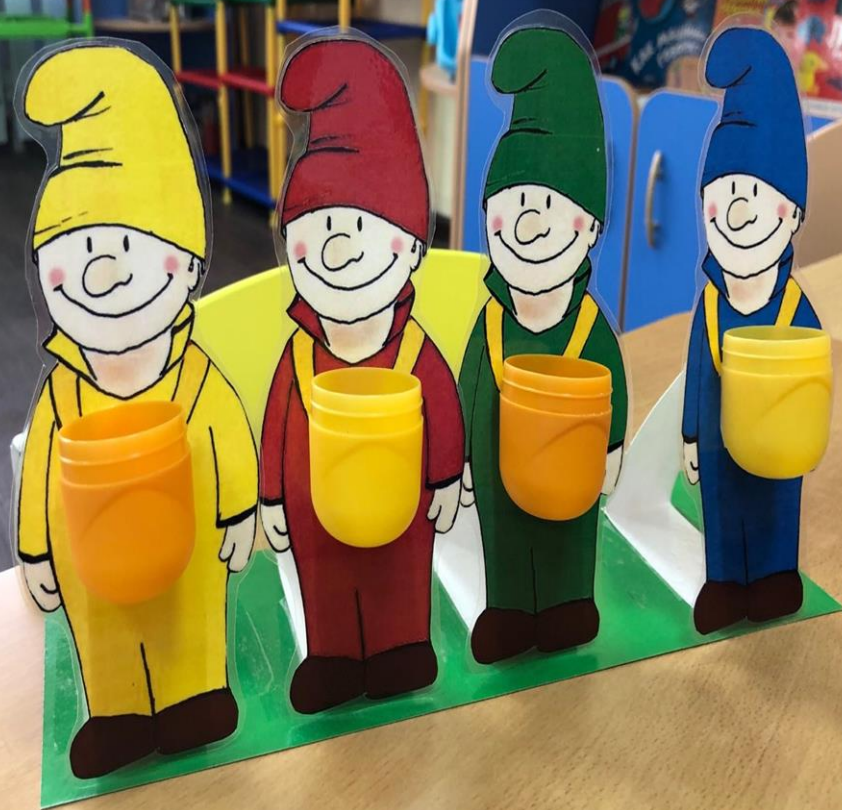
Дидактическая игра «Разложи сокровища своему гномику»