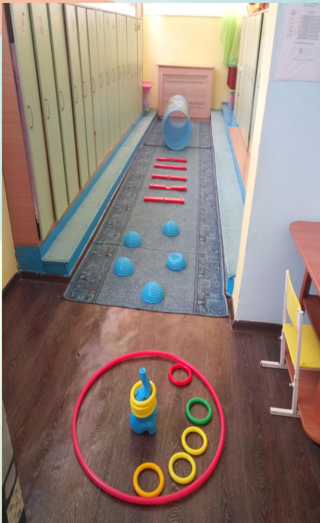
Организация двигательной активности в раздевалке группы