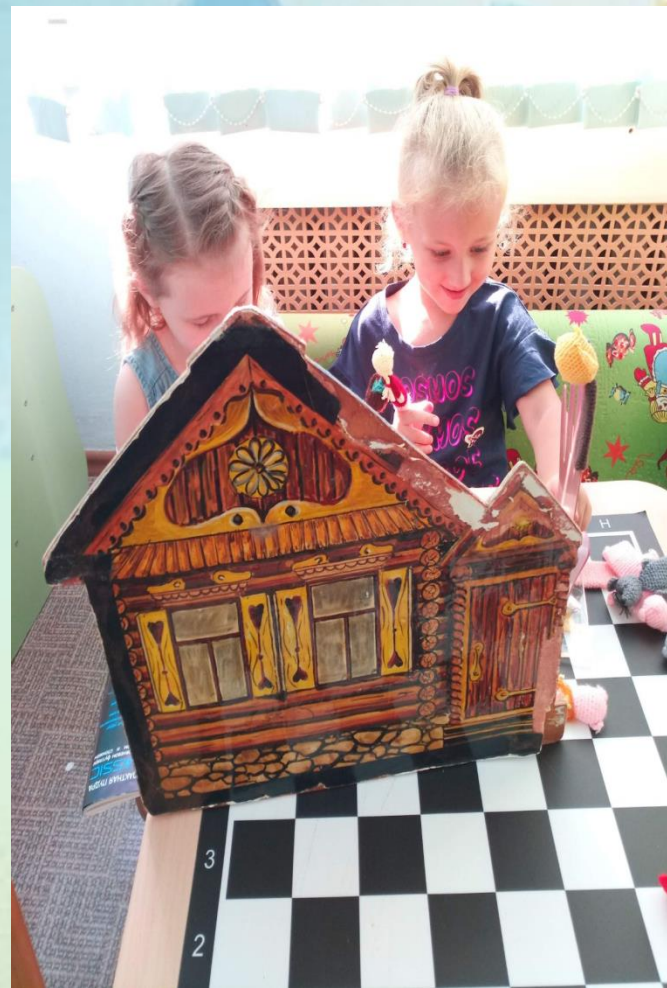
Дети могут выделить в групповом помещении пространство для парной или индивидуальной игры